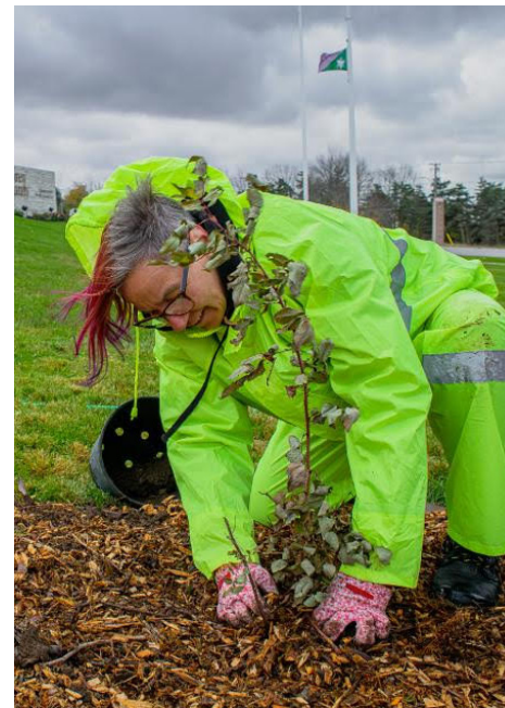
CÉRÉMONIE DE PLANTATION D'ARBRES DANS LE COMTÉ DE GREY, ONTARIO.

« Montrer l'exemple ». Cet événement visait à susciter l'intérêt pour une expansion de l'intendance bénévole axée sur la réconciliation dans la collectivité.