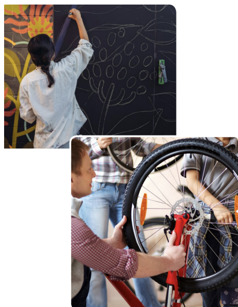
EXEMPLES D' ACTIONS DE LA BOÎTE À OUTILS : UNE INITIATIVE D' ACTION CLIMATIQUE POUR LES GROUPES COMMUNAUTAIRES. WWW.RDN.BC.CA/ACTION-FOR-CLIMATE-TOGETHER

Bien que le programme ACT respecte son objectif de départ, à savoir créer un programme d'éducation et de changement de comportement accessible et couvrant plusieurs secteurs (bâtiment, transport, gaspillage et nature), le programme lui-même a considérablement évolué par rapport à son concept initial. Par exemple, l'ACT renonce au programme basé sur les calculateurs de carbone en raison de préoccupations concernant l'exactitude et l'accessibilité des logiciels disponibles. L'équipe a également envisagé de collaborer avec un groupe d'action climatique local à but non lucratif afin de concevoir conjointement un programme d'engagement climatique qui encouragerait les actions individuelles et la prise de décisions durables dans le cadre d'un système de points et de prix. Cependant, la Ville, le RDN et le groupe en question ont décidé de renoncer au concept initial en raison de différences incompatibles quant aux messages, à la prise de décisions et à la hiérarchisation des actions soutenues par le gouvernement; ils continuent néanmoins à échanger et à se soutenir mutuellement de manière informelle. La Ville et le RDN ont changé de cap et ont mis sur pied le programme ACT comme moyen d'encourager les actions de groupe et de renforcer la résilience au sein des groupes, nouveaux et existants, notamment les quartiers et les organisations communautaires.