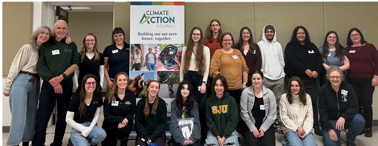
BÉNÉVOLES DU YOUTH CLIMATE ACTIVATION CIRCLE DANS LE COMTÉ DE DUFFERIN, ONTARIO.

Il est difficile d'anticiper tous les besoins de vos bénévoles lors de la conception d'un programme d'engagement, qu'il s'agisse de l'hébergement, du lieu ou de la fréquence des réunions. En prévoyant une certaine flexibilité, vous pourrez mieux adapter le programme aux besoins de vos bénévoles.