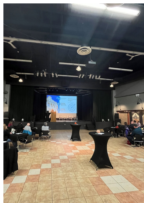
SESSION D'INFORMATION COMMUNAUTAIRE À NEW GLASGOW, NOUVELLE-ÉCOSSE.