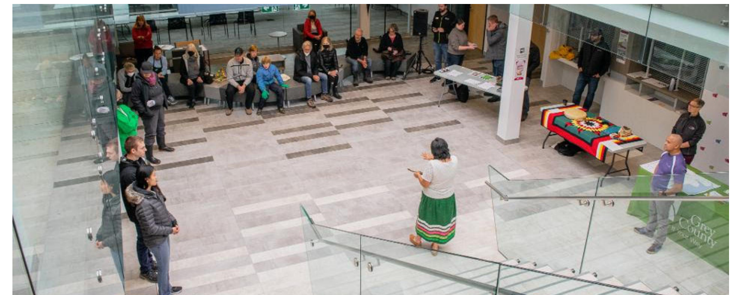
ÉVÉNEMENT DE NATURALISATION DANS LE COMTÉ DE GREY, ONTARIO.

Travailler à l'établissement de relations de partenariat avec les groupes autochtones locaux exige des gouvernements municipaux qu'ils repoussent les limites de ce qui est possible, notamment en matière de processus. Le bénéfice qui en découle est immense. La sensibilité des allochtones ou « de la brique » leur fait rechercher la clarté, des progrès prévisibles, des partenariats axés sur des mandats et des actions prioritaires. Pour s'associer de manière constructive au travail sur le climat, les municipalités doivent trouver les espaces nécessaires pour évoluer vers des relations de collaboration qui font de la place aux « sensibilités du fil » et les célèbrent. Des cérémonies seront organisées pour honorer l'ensemble de la création et rapprocher les participants à un niveau spirituel, tout en se laissant guider vers la meilleure façon de poursuivre le travail. Il s'est avéré que l'approche des sensibilités du fil a trouvé un écho auprès des organisations d'intendance bénévole locales et a été bien accueillie par la communauté.