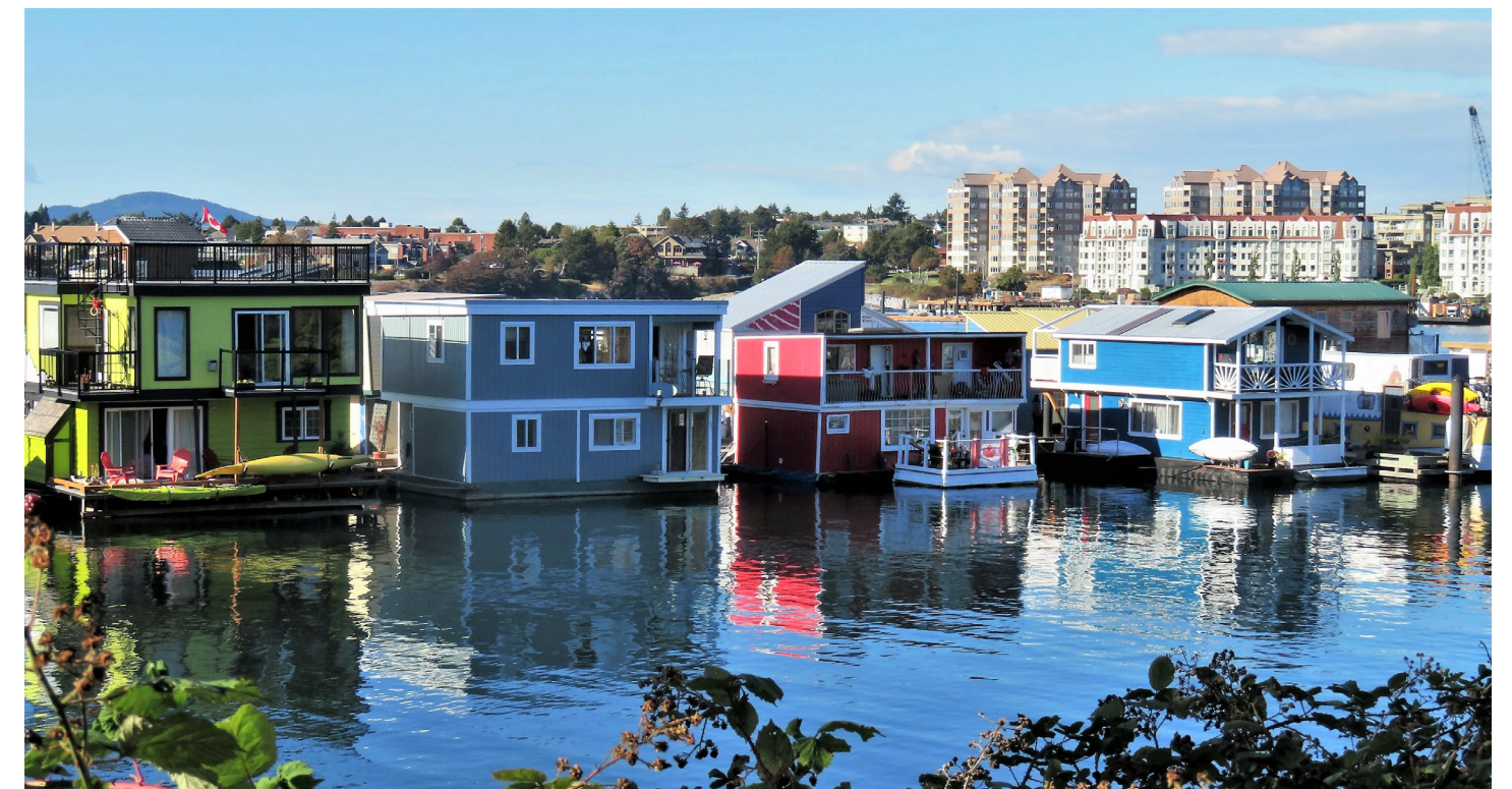
BATEAUX-LOGEMENTS À VICTORIA, COLOMBIE-BRITANNIQUE.

Pour que les administrations locales puissent atteindre leurs objectifs climatiques, chaque membre de la collectivité devra être habilité à prendre les mesures souhaitées. Les bénévoles communautaires de Victoria sont traditionnellement composés de propriétaires âgés, semi-retraités, souvent de race blanche, qui disposent du temps, des ressources et des capacités nécessaires pour participer à de tels programmes. Dans cette optique, l'équipe doit établir un dialogue constructif avec les groupes méritant l'équité dès le début du processus de conception d'un programme, afin de créer des liens et de connaître les obstacles à leur participation.