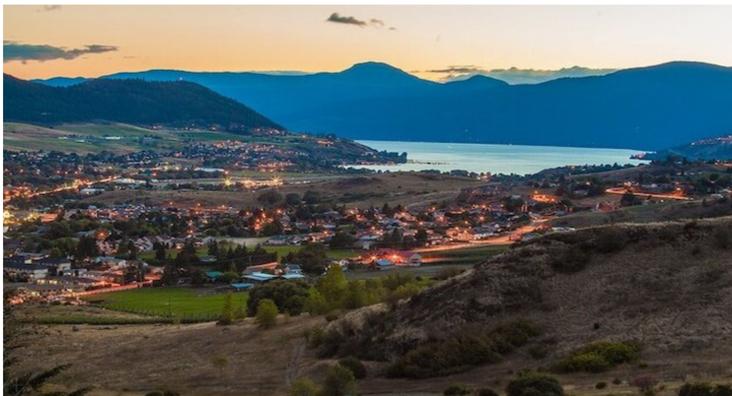
LE PROGRAMME DES AMBASSADEURS DU CLIMAT À VERNON, EN COLOMBIE-BRITANNIQUE, FAVORISE LA RÉSILIENCE DES QUARTIERS.

Lorsqu'on incite les résidents à prendre des mesures en faveur du climat, on a parfois tendance à solliciter les groupes communautaires qui sont déjà favorables et informés sur les changements climatiques. Les municipalités devront chercher de nouvelles façons de trouver un consensus afin de rallier des groupes et des résidents qui, traditionnellement, n'étaient pas inclus ou dont l'adhésion était plus difficile à obtenir.