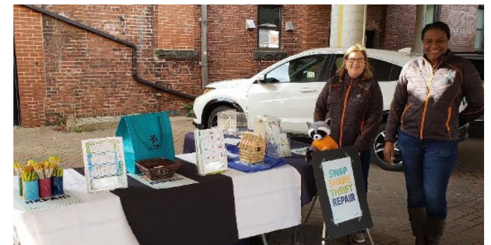
PARTICIPANTS AU PROGRAMME DES JEUNES AMBASSADEURS ET AU PROGRAMME DE L'ÉQUIPE CLIMAT DE COLCHESTER, EN NOUVELLE ÉCOSSE.