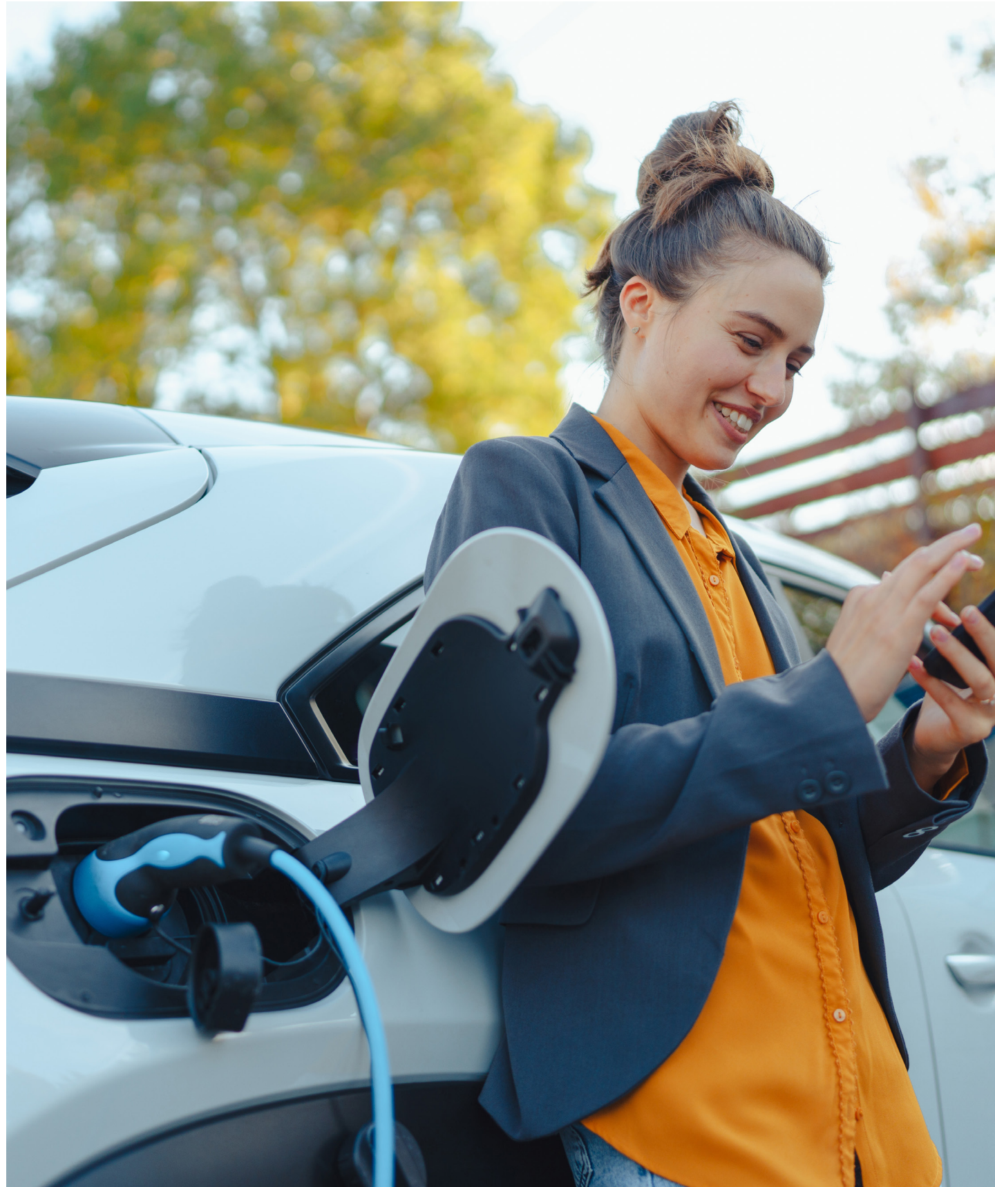
PROMOTION DE SOLUTIONS VISANT À RÉDUIRE LES ÉMISSIONS DE GES ET À RENFORCER LA RÉSILIENCE CLIMATIQUE À OTTAWA.

Pour aider les bénévoles du programme à organiser des dialogues communautaires pendant la première phase, une plateforme de ressources modulaire est en cours de réalisation. Cette plateforme comprendra des documents de la Ville et de sources externes. On y trouvera entre autres des exemples de présentations, des infographies, des messages sur les médias sociaux et des boîtes à outils. Ces ressources porteront principalement sur les conditions climatiques changeantes d'Ottawa, ses principaux risques climatiques et les populations les plus vulnérables, les actions pratiques pouvant être entreprises par les individus et les communautés, et les questions incitatives pour aider à encadrer les séances de dialogue. La plateforme de ressources sera accessible au public sur la page de Stratégie de la résilience climatique du site Web Participons Ottawa en février 2023.