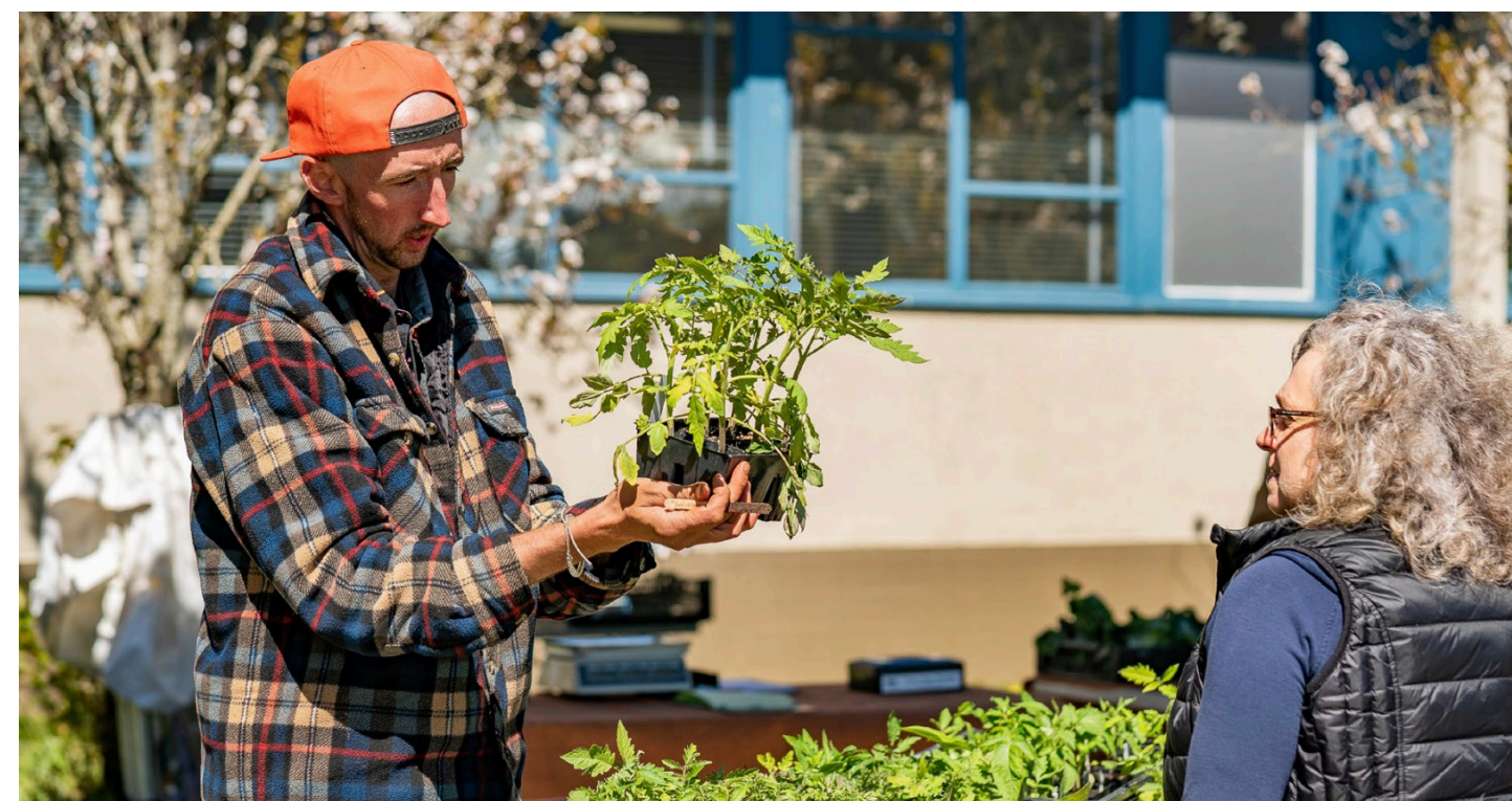
MEMBRES DE LA COMMUNAUTÉ ACTING FOR CLIMATE TOGETHER À NANAIMO, COLOMBIE-BRITANNIQUE.

La Ville et le RDN ont obtenu le financement nécessaire pour soutenir le programme ACT jusqu'en 2024 et au-delà, et ont élaboré des documents et du matériel pour soutenir le programme. L'équipe de la Ville et du RDN a engagé un graphiste pour créer un logo, une brochure, une boîte à outils pour les participants et un modèle de diapositives PowerPoint. Un site Web a également été conçu et lancé, et tout le matériel créé à ce jour a été révisé par un rédacteur professionnel afin de le rendre plus accessible et motivant pour les participants potentiels. Tous les supports ont également été pensés pour être utilisés pendant de nombreuses années.