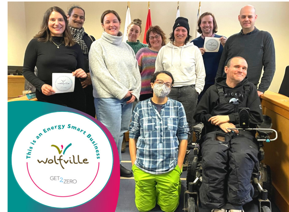
PARTICIPANTS AU PROGRAMME GET2NET-ZERO DE WOLFVILLE, NOUVELLE-ÉCOSSE.

Lorsque vous ciblez ou travaillez avec le milieu des affaires, il est important de recenser les options qui demandent relativement peu de temps. Les mois de septembre à janvier sont très occupés pour les entreprises de Wolfville, et ce facteur a joué sur la capacité des propriétaires d'entreprises à s'engager dans ce programme pendant cette période. Les mois qui suivent les vacances d'hiver ont tendance à être plus calmes et l'on s'attend à ce que le programme enregistre une plus grande participation à ce moment-là.